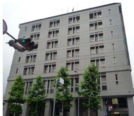
ハートピア京都 外観